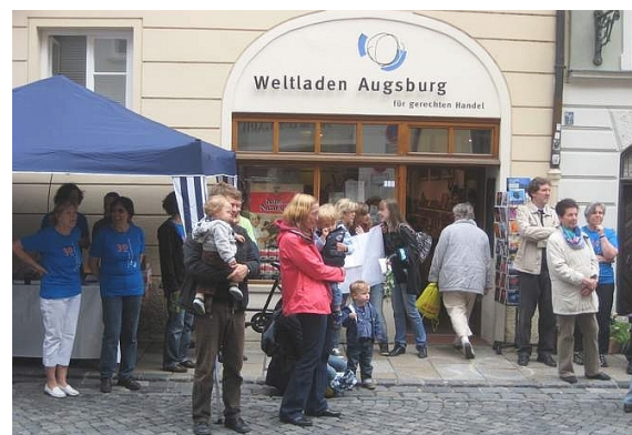
Straßenfest in der Weißen Gasse