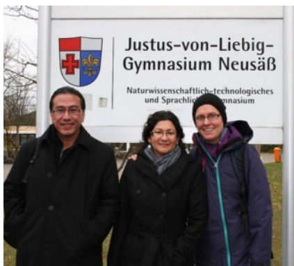
Bildung, Mode und mehr