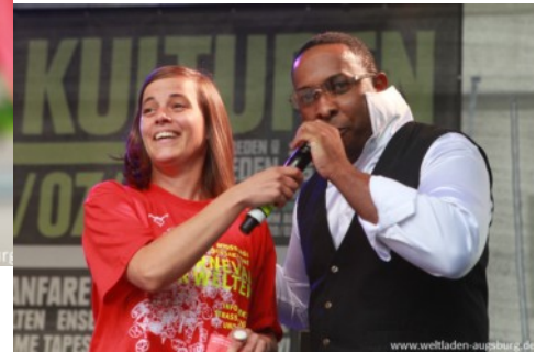
Karneval der Welten